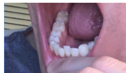
Dientes inferiores, Lado de la lengua