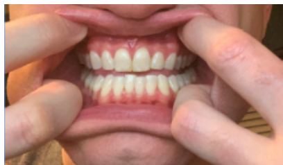
Dientes frontales, Lado del labio

Mire las siguientes 3 imágenes como una guía de las fotos que necesitaremos para su visita de Teledentista, incluya otras fotos adicionales de cualquier área que le angustie.