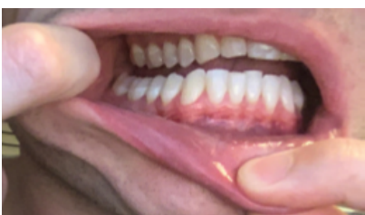
Lado de la mejilla, Superior e inferior