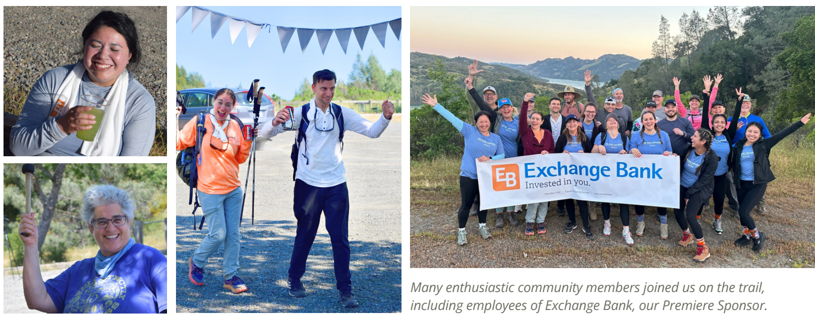
Many enthusiastic community members joined us on the trail, including employees of Exchange Bank, our Premiere Sponsor.

Our fourth annual Epic Trail Challenge (ETC) took place on Saturday, May 13, at beautiful Lake Sonoma in Guerneville. Participants hiked 11+ or 20+ miles to raise funds for SRCH's newest endeavor for elders in our community—AgeWell PACE. This program provides comprehensive services for seniors with low incomes and multiple serious health conditions. 13 teams and 63 individuals raised funds through ETC for this new SRCH initiative. Thank you to ALL our epic Challengers, volunteers, and supporters!